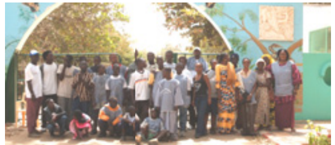
Sortie au Parc Zoologique de Hann

Le Centre organise pour les enfants un à deux événements phares par trimestre. Il y a la fête de Noël, le mardi gras, la fête de la marraine jour de la kermesse porte-ouverte, ou encore la fête des anniversaires. L'année dernière, les enfants ont visité le parc zoologique de Hann et nous ont passé 3 jours de voyage d'école à Popenguine avant de clôturer l'année par la fête de remise des prix.